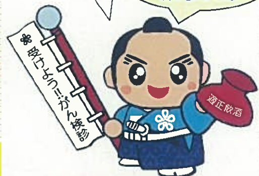
福岡県がん検診受診率向上イメージキャラクター 「検診くん」