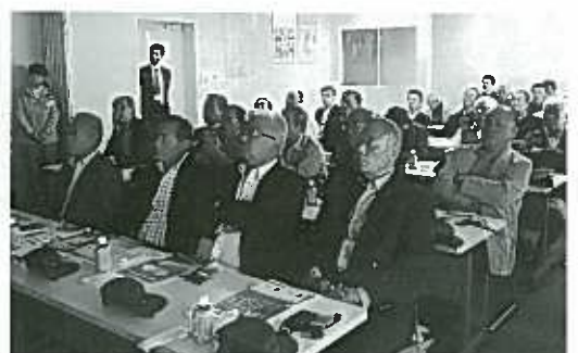
有明ソーラーパワーの説明を受ける様子

両県に及ぶ広域的ダイオキシン対策と廃棄物のサーマルリサイクルの一環として、大牟田及び荒尾市から排出される可燃物ごみを収集し、乾燥・選別・粉碎・成形の工程から固形燃料を作り、リサイクル発電所の燃料として供給することで、ごみ焼却炉におけるダイオキシン類排出量削減に努める循環型まちづくりの一翼を担う重要な施設でした。 今回、視察研修に参加頂いた事業所皆様には、新エネルギーへの取組み・排出ごみの適正処分等、「環境保全」により一層努めて頂ければと思います。 工業部会先進事業委員会