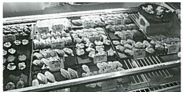
おいしそうなお寿司がたくさん