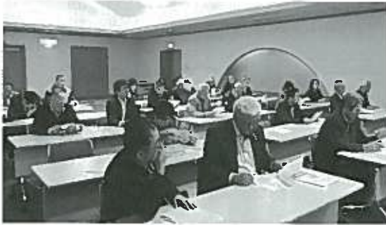
山口商工会議所にて

一日目の午前中は岩国市の錦帯橋を見学しました。錦帯橋は、日本三大橋や日本三大奇に数えられており、名勝に指定されています。錦帯橋を渡ると吉香公園から岩国城まで岩国ロープウェイで結んでおり、その岩国城からは、遙か遠くの四国まで望め、大変壮観な眺めでした。午後からは山口商工会議所において、山口中心商店街連合会・会議所