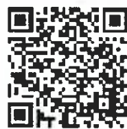
上記QRコードを読み取ると、直接アクセスできます。

《NHKプロジェクト》 キラキラうきはでは、以前「NHKプロジェクト100万人の花は咲く」へのミュージックビデオに投稿したところ、見事、ホームページ上で紹介されました！ぜひ、一度ご覧下さい。